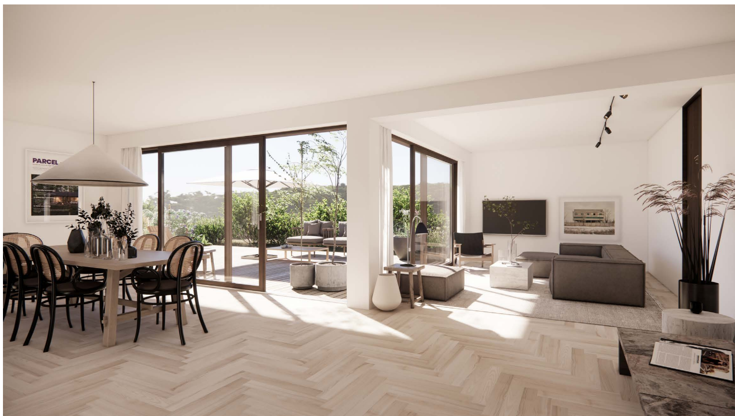
Nye gulve med gulvvarme i hele huset. Sildeparket i eg.

Facaden mod terrassen har fået nye store skydepartier og huset kan åbnes helt op om sommeren.